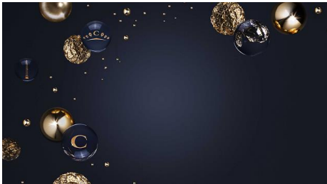
PC用・オリジナル壁紙

ご予約いただいたお客様には、ショーメの世界観を楽しんでいただける オリジナル壁紙（PC/ モバイル用）をプレゼントしています。