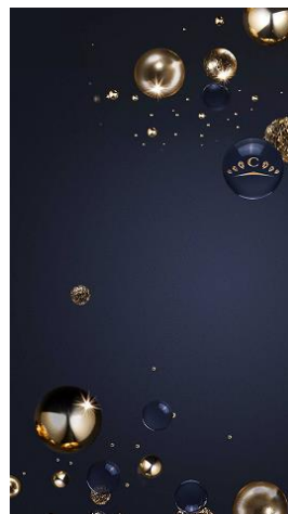
モバイル用・オリジナル壁紙