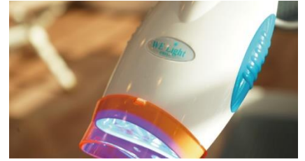
「WE Light クラスII」

日本最大のデンタルエステチェーンを運営するエイ・アイ・シーが研究を重ねた結果、ホワイトニング効果を高めるのは「熱温度」ではなく「放射照度（単位面積あたりの光の量）」だと解明。光による漂白効果を有効とする日本初の歯面漂白用活性化装置「WE Light クラスII」を自社開発しました。