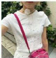
ファッション 「ローズチョーカー」