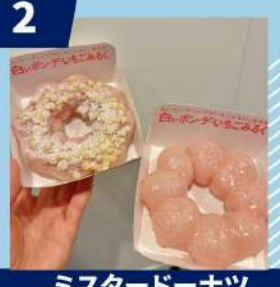
ミスタードーナツ 白いポン・デ・いちごみるく