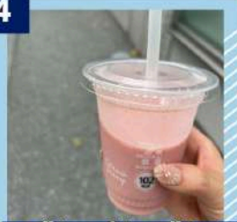
セブンイレブン スムージー