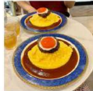
食べ物 「Sweet Check」