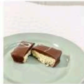
食べ物 「ドバイチョコ」