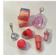
物事 「キーリングコスメ」