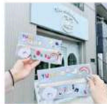
スポット 「THE ASOBOARD」