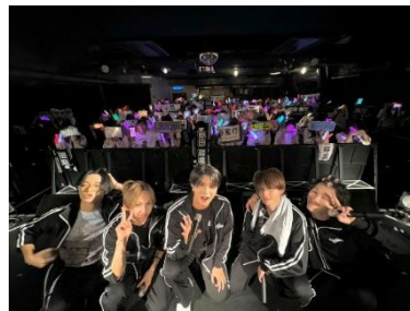
* 2 早朝ライブ