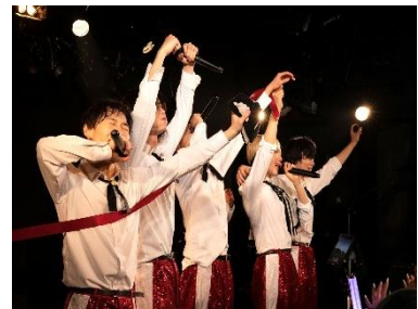
* 3 12時間耐久ライブ