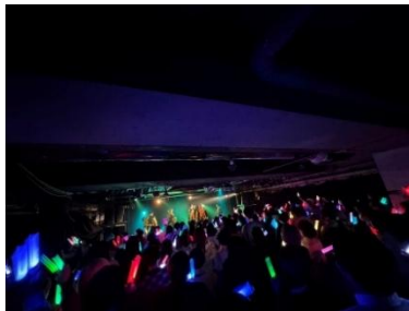
* 1 真夜中ライブ

いつでも、真夜中でも、早朝でも12時間耐久ライブにも駆けつけてくれる* 3 ファンの存在が、世が世なら!!の活動の原動力。ライブに来れば撮影タイムで『推しカメラ』を撮影してはSNSに投稿して拡散してくれる。そんな応援してくれるファンに、全力で感謝を返せる一石二鳥の企画はないのだろうか—そんな思いから生まれたのが、 「推し活を布教しながらお金を稼げるアルバイト」という新しい形のファン参加型プロジェクト。