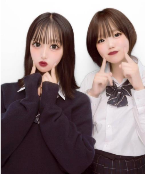
▼8位 わんわんポーズ