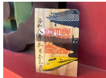
限定御朱印のイメージ

総漆塗り、豪華絢爛な社殿を有する「静岡浅間神社」と静岡の文化財を護る「オクシズ漆の里協議会」とのコラボ企画第二弾！神社の社殿を護る「漆」の木から作った突板に、新幹線の安全を守ってきた JR 東海のドクターイエローと社殿、日本のシンボル富士山をあしらったオリジナルデザインの「漆の木御朱印」をご用意しました。