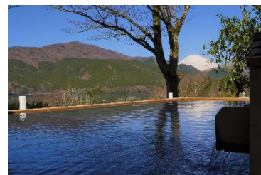
龍宮殿本館 男性風呂「夢殿」