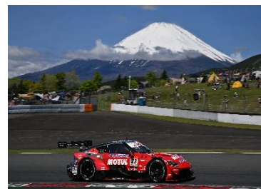
※富士スピードウェイのイメージ （当日レーシングカーの展示はございません）