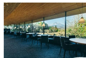
Maison KEI レストラン内観

予約の取りづらいランチタイムのお席を特別にご用意しました。大きな窓から雄大な富士山を望む空間で、季節の野菜を使った“もれなく富士山”限定の1皿を盛り込んだ「春のEX 特別ランチコース」を是非ご堪能ください。