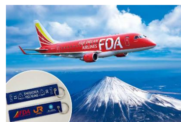
富士山遊覧フライトとタグのイメージ

さらに、JR 東海×富士山静岡空港×FDA がコラボした、オリジナルフライトタグ付き。