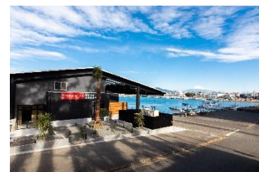
用宗みなと温泉 外観