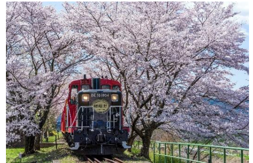
嵯峨野トロッコ列車

春の保津川渓谷をめぐる嵯峨野トロッコと、嵐山で人気の京綿菓子専門店「zarame」の京綿菓子がセットになったプランをご用意しました。桜のトンネルや清流などトロッコからの車窓の風景と、京都産の素材を活かした京綿菓子をご堪能ください。