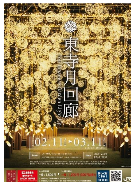
「東寺月回廊」ポスター