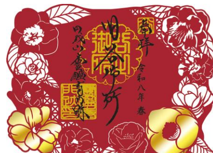
霊鑑寺 切り絵御朱印