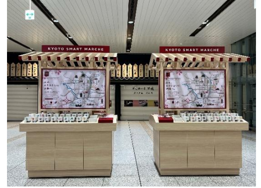
京都スマートマルシェ イメージ

春の観光シーズンにおける混雑緩和と、快適な京都観光をサポートする取り組みとして、京都駅新幹線改札内に期間限定で「京都スマートマルシェ」を設置します。主要観光地へ向かう際に混雑を避けやすい移動ルートや、地下鉄・電車を活用したおすすめのアクセス方法、周辺の見どころ情報を分かりやすくまとめた案内カードを配布。旅の目的や時間帯に応じて、無理なく京都を楽しめる観光プランづくりをサポートします。