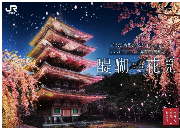
醍醐花見 イメージ

東海旅客鉄道株式会社（以下、JR 東海）では、「そうだ 京都、行こう。」2026 年春キャンペーンを 2 月 10 日（火）から 4 月 30 日（木）までの期間で実施いたします。今年は「春の花々」をテーマに、桜、椿、梅が彩る京都の社寺や風景の中で、心華やぐひとときを過ごせる特別な観光コンテンツをご用意いたしました。