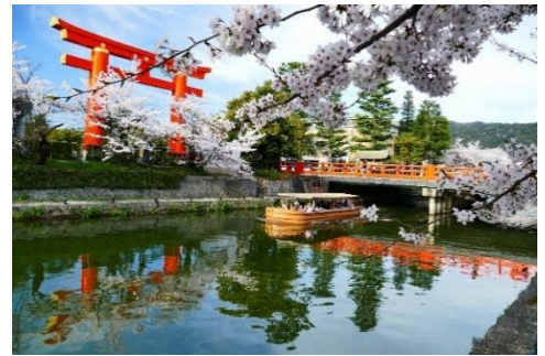
岡崎さくら回廊十石舟

岡崎地区の琵琶湖疏水沿いに咲き誇る桜で彩られた景色を眺める船旅に「EX 旅先予約」専用予約枠をご用意しました。南禅寺舟溜り乗船場～夷川ダムまでの往復約 25 分間で桜の名所をめぐる船上からのお花見をお楽しみください。