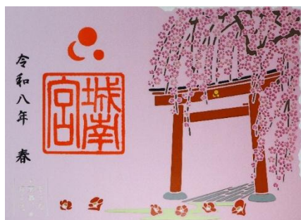
城南宮 切り絵御朱印

＜対象施設＞ 城南宮、三室戸寺、霊鑑寺門跡、六角堂（頂法寺）、妙心寺退蔵院、平野神社