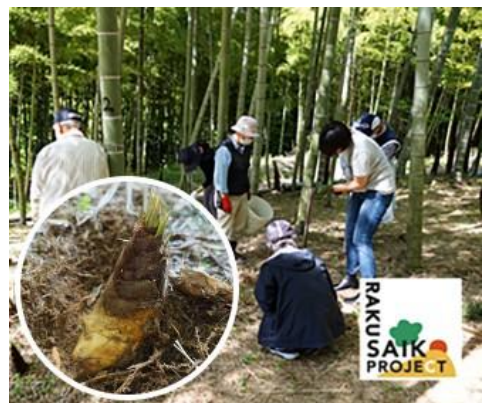
たけのこ掘り体験 イメージ

「京たけのこ」の産地の一つである、京都・西山エリア。その麓に佇む正法寺にて、僧侶による法話と、地元農家の方々とのおたけのこ掘りを体験いただけます。新鮮なたけのこをその場で味わい、お持ち帰りいただける、春ならではの贅沢な体験をお楽しみいただけます。