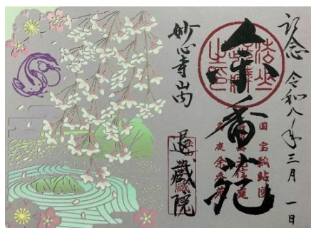
妙心寺退蔵院 切り絵御朱印