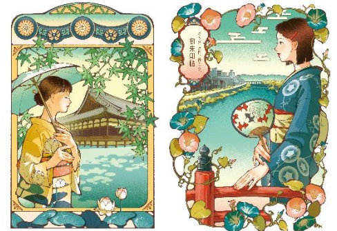
特別御朱印（青蓮院門跡） イメージ