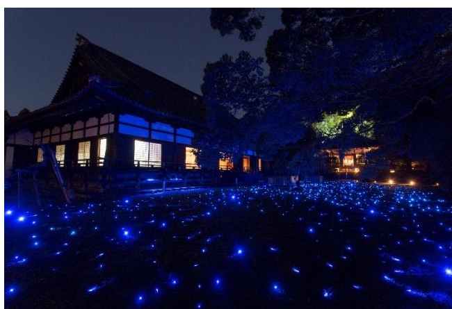
青蓮院門跡 ※写真は秋に開催されたライトアップの様子です。

東海旅客鉄道株式会社（以下、JR 東海）では、「そうだ 京都、行こう。」キャンペーン“緑の彩り編”の特設サイトを公開し、特別な観光体験プランの予約受付を4月23日（木）より開始しました。