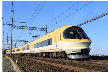
伊勢志摩ライナー イメージ