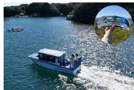
英虞湾周遊クルーズ・車窓カード イメージ