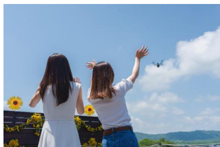
志摩スカイショット 撮影イメージ