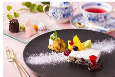
EX サービス会員向けカフェメニュー イメージ