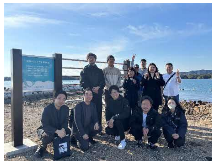
企画メンバーで集合写真

近鉄「賢島駅」徒歩約1分の賢島港から、定期船で約10分。アクセスの良さも魅力の間崎島は、現在約30人の島民が真珠養殖という伝統と暮らしを守り続けている小さな島です。潮の満ち引きという自然のリズムが生む、限られた時間にだけ現れる一瞬の“海の道”。人の営みと自然が寄り添うこの島で、日常を離れ、海と向き合いながら願いを託す特別な時間をお過ごしいただけます。本プランは、JR 東海、近鉄グループホールディングスや志摩市、島民の皆様と連携し誕生した、〈今だからこそ体験してほしい〉唯一無二のプログラムです。