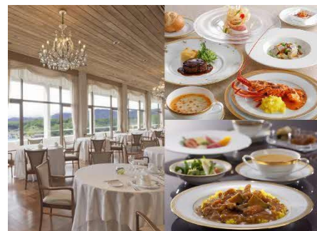
志摩観光ホテル 館内・ランチプラン イメージ