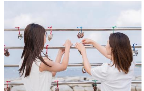
マーメイドロード・真珠の貝殻願掛け イメージ