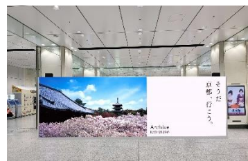
※東京駅イベントスペースイメージ