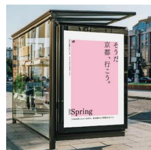
※バス停展開イメージ