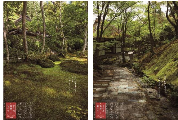
B1 ポスタービジュアル（祇王寺・常寂光寺）