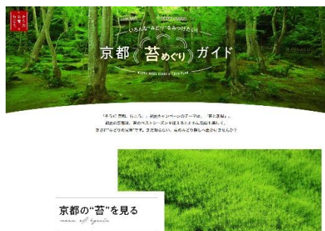
「京都の苔めぐりガイド」ページイメージ