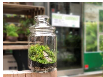
苔テラリウム(イメージ)