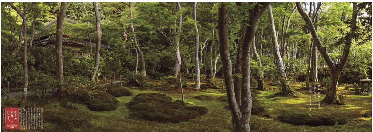
B0×2ポスター<苔と新緑編>(イメージ)

一面の苔と青もみじに柔らかく包まれた初夏の情景をメインビジュアルに据え、美しい写真と映像でお伝えします(写真は祇王寺)。