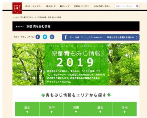
「青もみじ情報」ページイメージ