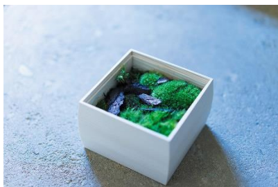
かたかげ(イメージ)