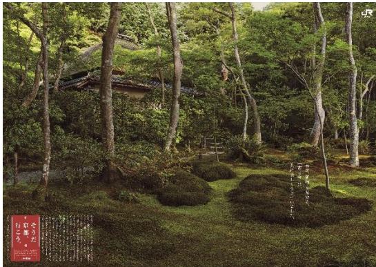
B0 ポスタービジュアル（祇王寺）