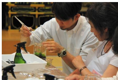
ワークショップ(イメージ)