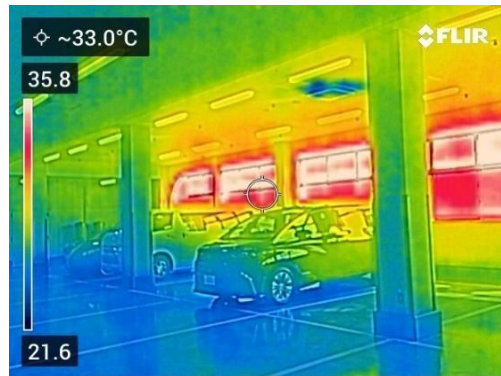
工場内 26°C に対して窓際温度は 50°C 近くまで上昇（自動車整備工場で計測）

近年の暑すぎる気候に対し、厚生労働省は、特に熱中症のリスクがある作業に関する事業者の義務について、一部規則を改正し、省令を 2025 年 4 月 15 日に公布、同年 6 月 1 日から施行します。規定の目的は、熱中症のリスクを軽減し、作業者の健康と安全を守ることです。事業者は、適切な体制と手順を整備し、作業者に対して十分な情報提供を行うことが求められています。