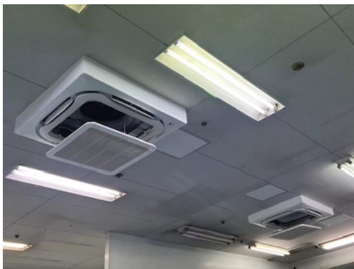
＜関東圏 国産車ディーラー＞ エアコン（オートグリル活用中）設置事例

整備工場向けエアコン専用キュービクル「ピットキューブ」の需要拡大も、後押しとなりました。