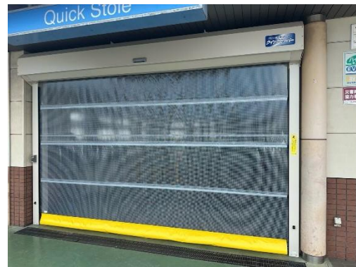
＜中国地域 トヨタディーラー＞ 高速シートシャッター設置事例