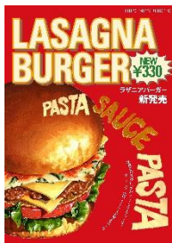
2001年発売 ラザニアバーガー

「効率性からは必ずしも生まれないチャレンジングなバーガー」は多くの話題にも繋がっています。