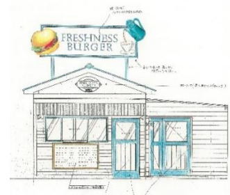
当時の創業者直筆の設計図

最寄の駅から徒歩15分。その場所で創業者が店舗にしようと思った物件は、劇団の稽古場として使われていた木造の一戸建て。不動産屋からは「何をやっても商売にならなかった」と言われたほど、人通りの少ない場所にたたずんでいました。