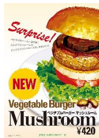
2009年発売 ベジタブルバーガー (マッシュルーム)