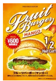
2011年発売 マンゴーバーガー