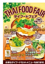
2015年発売 ガバオバーガー