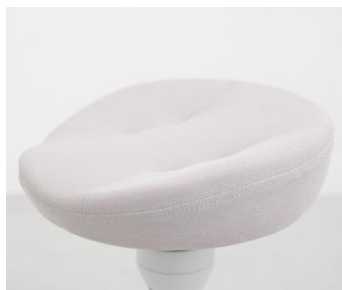
立体座面で骨盤安定