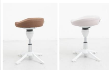
ゆらキュットチェア