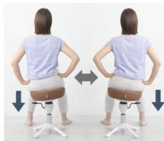
ウエストのシェイプエクササイズも簡単