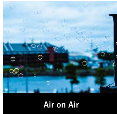
Air on Air

見慣れた場所に「いつもの日常を新しいものに変える」作品が登場します。 ワークショップも開催予定。