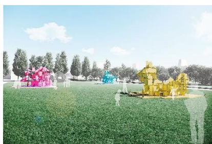
unnamed — 視点を変えて見るデザイン —

体験型インスタレーションが芝生広場に登場！視点を変えることで「なにか」に出会う。