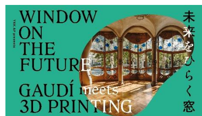
未来をひらく窓 — Gaudí Meets 3D Printing —

木々に吊るされた色鮮やかなイラストがミッドタウン・ガーデンに登場！表側をよく見ると何かが隠れている？