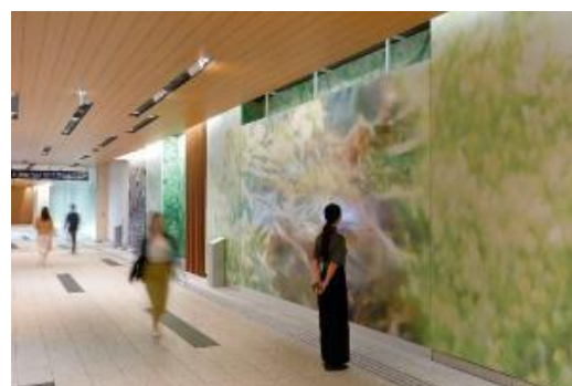
▲昨年の展示の様子

【期 間】 10月14日(木)～11月7日(日) (予定) 【場 所】 プラザ B1 メトロアベニュー 【展示作品】 TOKYO MIDTOWN AWARD 2021 受賞及びファイナリスト作品 (16 点) ※期間中は一般投票で人気作品を選出する「オーディエンス賞」も実施します ※デザインコンペの受賞作品は展示終了後も約 1 年間、東京ミッドタウン館内に展示します