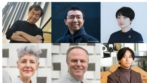
▲未来の窓について語った著名建築家の方々

建築家アントニ・ガウディの窓に学び、自然環境と呼応する様々な機能や素材、造形をもった3Dプリンタによる未来の窓のプロトタイプデザインをYKK APと鈴木啓太氏が提案します。