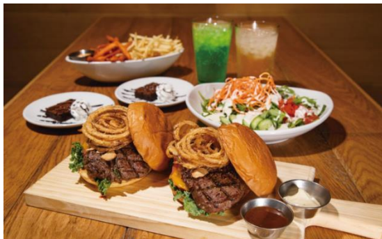
▲写真は 2 名様分