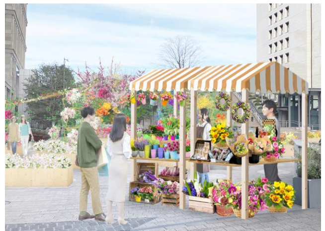
◆HIBIYA BLOSSOM FLOWER WAGON イメージ