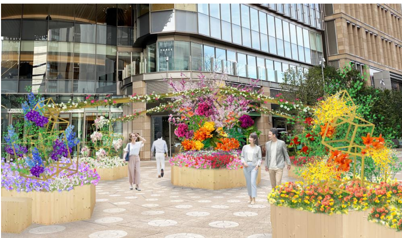
◆HIBIYA BLOSSOM GARDEN イメージ

写真映え間違いなし！春の訪れを感じる色とりどりの花装飾が広場に登場。 フラワーワゴンではおうち時間を彩るお花の販売も。