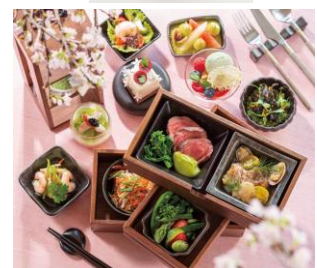
画像は全てイメージ

本館 17階から“春の日比谷”を眺めながら、ホワイトアスパラガスや蟹、山菜など季節の食材を詰め込んだ BENTO で至福のひとときをお過ごしください。