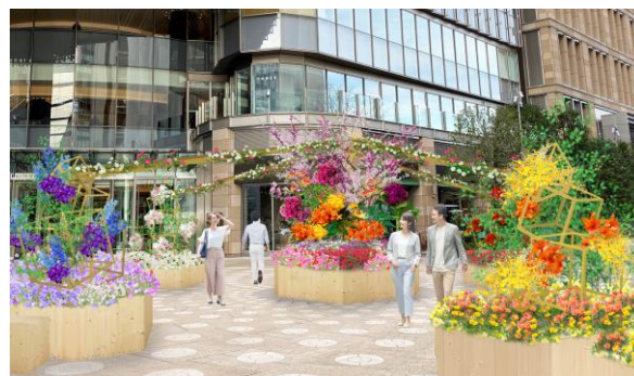
画像は全てイメージ