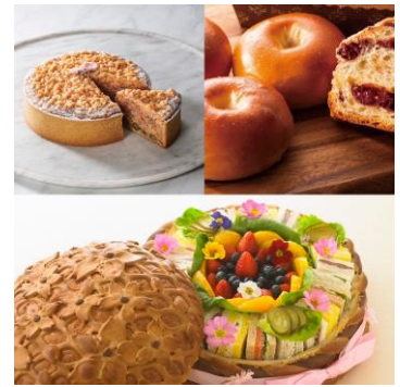
画像は全てイメージ

提供場所：帝国ホテルプラザ 東京 1階 ホテルショップ「ガルガンチュワ」 提供期間：3月1日(火)～4月30日(土) ※一部4月17日(日)まで 営業時間：10:00～19:00 限定メニュー：・桜のタルト 4,300円(税込) ※4月17日(日)まで ・桜あんぱん(2個入り) 650円(税込) ・ガルガンチュワサンドイッチ(桜) 13,000円(税込) ※7日前まで要予約 ※数量限定