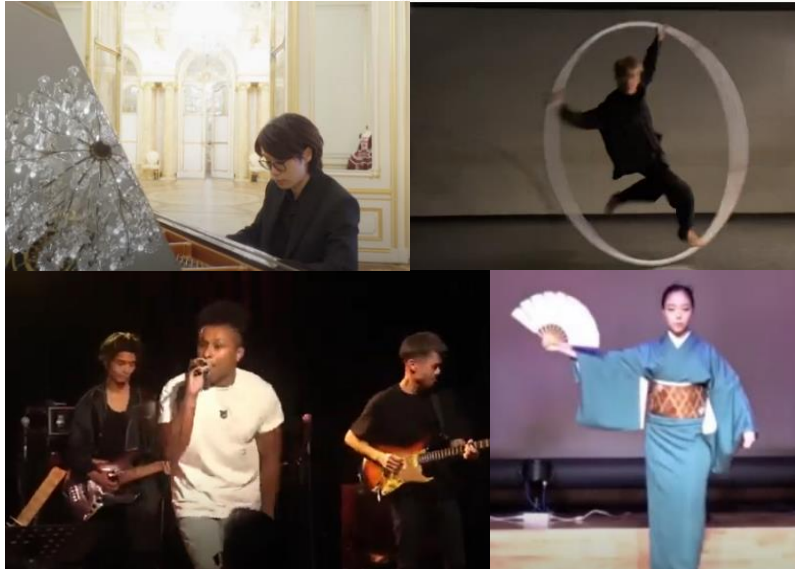
選考応募パフォーマンス動画の一部

東京ミッドタウン日比谷（千代田区有楽町 事業者：三井不動産株式会社）を運営する東京ミッドタウンマネジメント株式会社が実施する、コロナ禍における芸術文化・伝統芸能の才能発掘・発信を目的とした「あなたが NEXT アーティスト！～ウィズコロナ 若手応援プロジェクト～」企画において、選考により 15組の「NEXT アーティスト」が決定 いたしました。選出された「NEXT アーティスト」は、日比谷・銀座の様々な場所でパフォーマンスを行い、その映像を3月より順次、YouTube チャンネル『HIBIYA FES CHANNEL』で公開いたします。