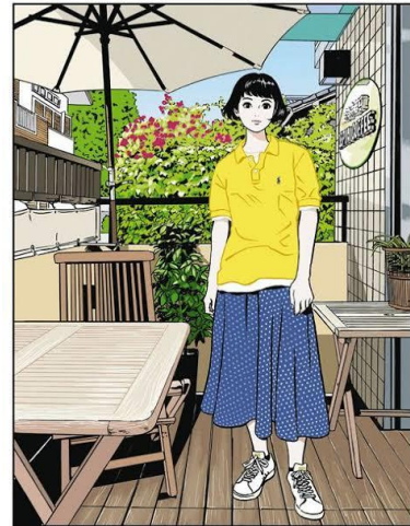
ラルフローレン公式 WEB インタビューのためのイラスト（2022） ©2023 Eguchi Hisashi