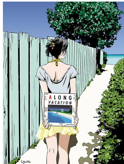
展示作品の一部(左：銀杏 BOYZ「君と僕の第三次世界大戦的恋愛革命」CDジャケット(2005)、 右：大滝 詠一「A LONG VACATION」40th トリビュートイラスト(2021)) ©2023 Eguchi Hisashi

漫画家・イラストレーターとして活躍する江口寿史氏は、東京という街と街の中で輝く人々の瞬間を克明に描き、街と人の魅力を伝え続けています。今回、東京ミッドタウン日比谷が5周年を迎え、日比谷エリアの様々な場所も周年を迎えることから、街とエンターテインメントをつなぐクリエイターとしてオファーし、日比谷ならではの特別展示として江口寿史イラストレーション展『東京彼女』が実現しました。