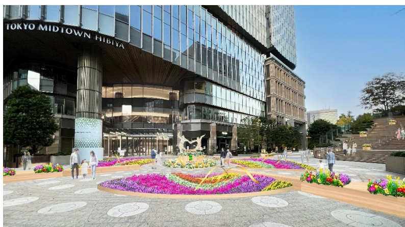
「CELEBRATION FIELD OF FLOWERS」イメージ

名 称： CELEBRATION FIELD OF FLOWERS 開催期間：2023 年 3 月 17 日（金）～4 月 23 日（日） 開催時間：11:00～23:00（夜間はライトアップを予定） 開催場所：東京ミッドタウン日比谷 日比谷ステップ広場 主 催：東京ミッドタウン日比谷