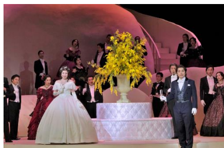
オペラ『椿姫』より「乾杯の歌」