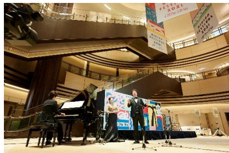
コンサート（イメージ）

名 称：5 th Anniversary Concert 開催期間：2023年3月29日（水）～4月2日（日） 開催時間：平日 18:30～/19:30～ 土日 13:00～/15:00～/17:00～ ※予定 開催場所：東京ミッドタウン日比谷 1F アトリウム 入場料金：無料 主 催：東京ミッドタウン日比谷 協 力：遠州楽器制作株式会社