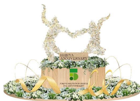
シンボルオブジェのイメージ