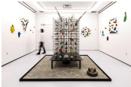
《宇宙の箱舟》