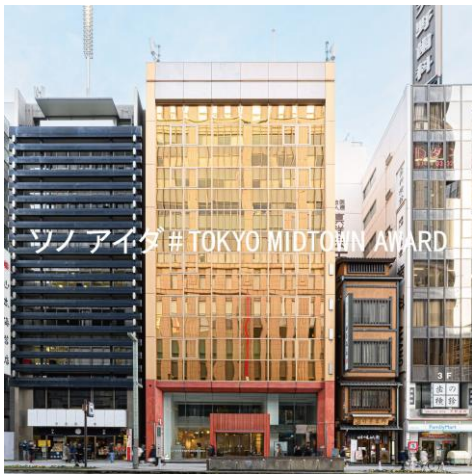
▲「ソノ アイダ # TOKYO MIDTOWN AWARD」 日本橋室町162ビル外観