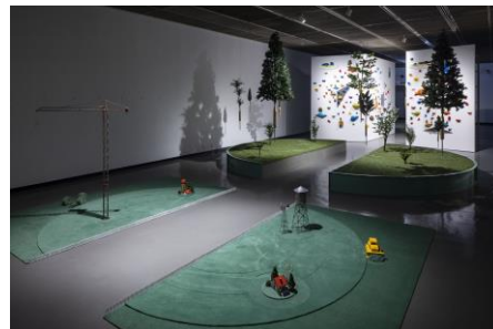
《Monkey trail》