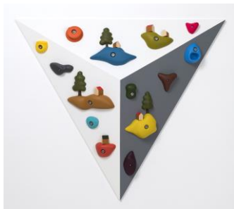
《Floating Islands #04》