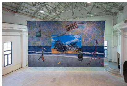
《セカイノセカイ - 風をあつめて、そらにはなつ / World of the world-Gathering wind, to send off into the sky》 ©Yohei Yamakami