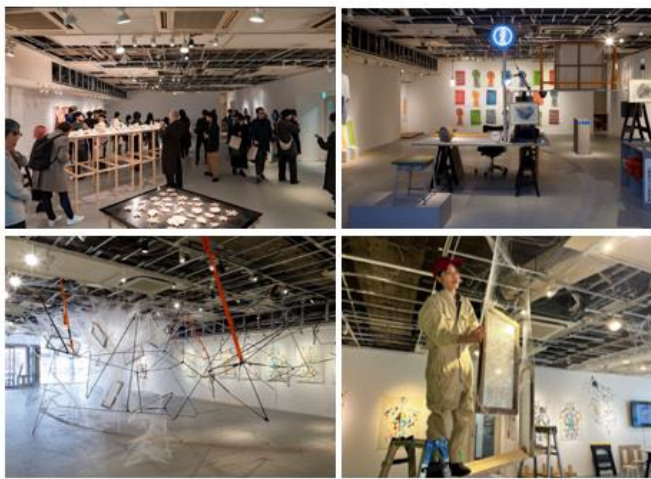
(左上) 第1期成果展内覧会の様子 (左下) 第3期展示