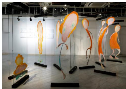
▲まちだりな氏作品