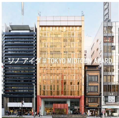
▲ 「ソノ アイダ # TOKYO MIDTOWN AWARD」 日本橋室町162ビル外観

また、日本橋のメインストリートである中央通りに面した日本橋室町162ビルがアトリエの拠点となったことで、近隣居住者や周辺オフィスワーカー、観光客など多くのビジターとの交流が生まれ、日本橋の街にアートを介した新たな賑わいが創出されました。