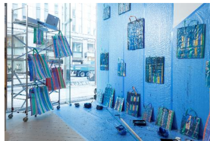
▲Sareena Sattapon 氏作品