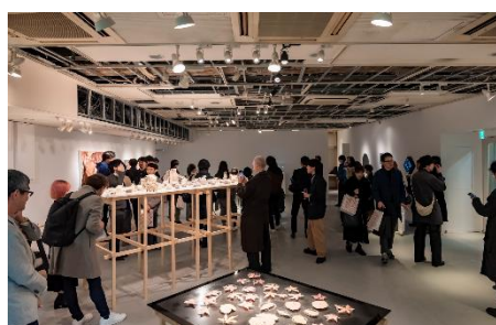
▲第1期成果展内覧会