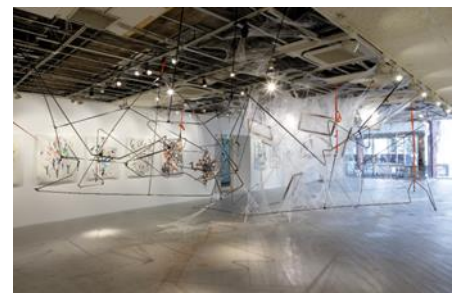
▲後藤宙氏作品 (写真手前・奥)