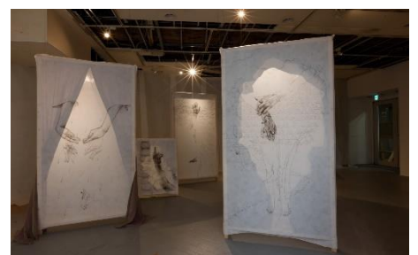
▲牧野永美子氏作品