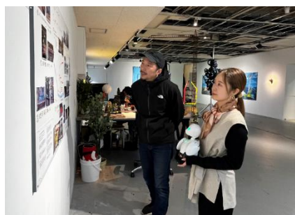
▲第5期アーティスト角文平氏は、日本橋の「分身ロボットカフェ DAWN ver.β」とコラボレーション。これを受け、分身ロボット「OriHime」が作品鑑賞のために来訪。