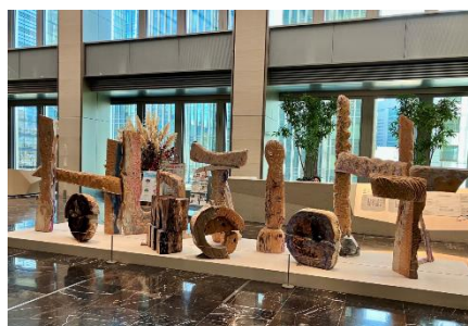
▲第2期参加アーティスト山口正樹氏が本プロジェクトで制作した作品「Hold Me Tight」が日本橋室町三井タワーに期間限定で展示。