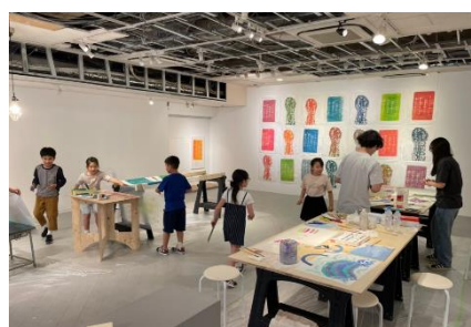
▲キッズワークショップの様子