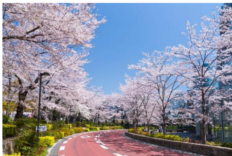
▲日中のさくら通り(過去の様子)

約 100 本の桜が並ぶ東京ミッドタウンの桜並木。イベント期間中は、開花状況に合わせて桜のライトアップを行い、鮮やかな夜桜もご覧いただけます。都心にいながら、昼と夜で表情を変える桜をお楽しみください。