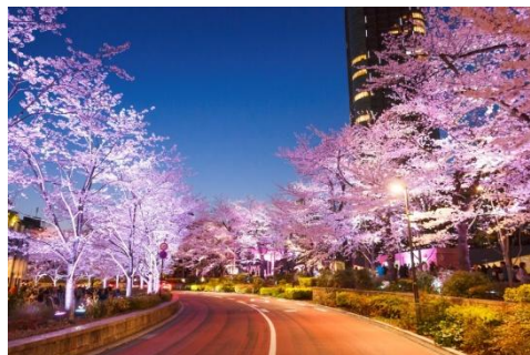
▲ライトアップ時(過去の様子)