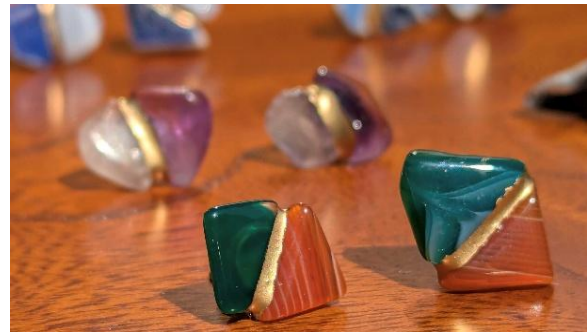
▲箸長 金継ぎアクセサリーイメージ

アーティストとともに作品づくりを楽しむプログラムをはじめ、金継ぎにチャレンジできるアクセサリーづくり、香袋の調香体験、カレー・チャイ講座など、幅広いラインナップをご用意。期間中は、お子さまと参加できるプログラムも含め、約20種類100講座を超えるワークショップを開催予定です。