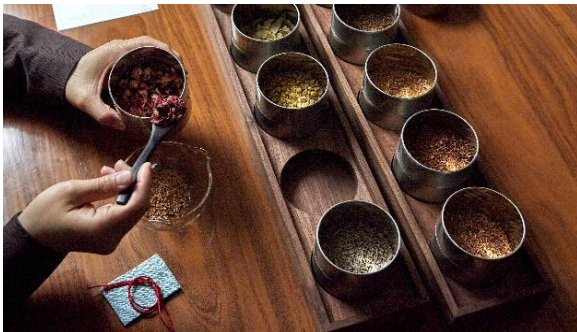
▲薫玉堂 調香体験イメージ

今夏は猛暑が予想されるなか、涼しい館内でアートやデザイン、クラフト、食文化に触れながら学びや創作を楽しむ“大人のための屋内体験コンテンツ”を新たに拡充。東京ミッドタウンがこれまで育ててきたアーティストやデザイン・アート施設、店舗とのネットワークを活かし、ここでしか出会えない多彩なワークショップを展開します。