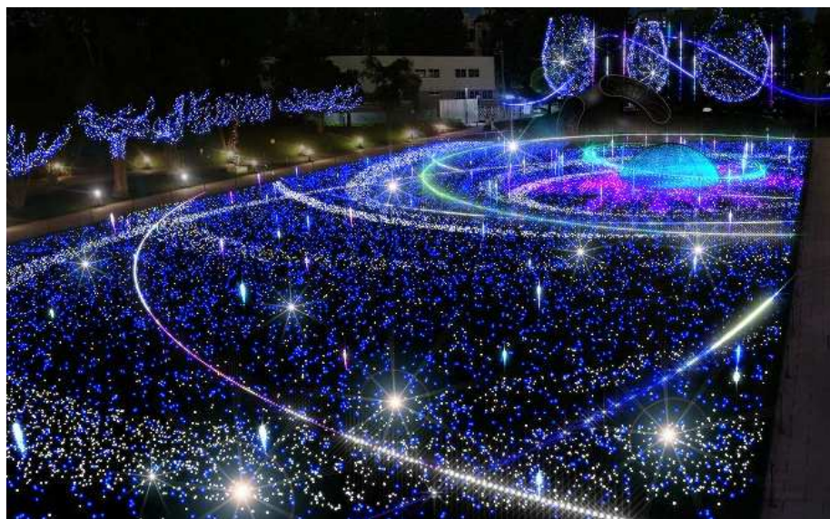
▲曜日ごとに異なる演出！「スターライトガーデン 2017」(イメージ)

東京ミッドタウン(事業者代表 三井不動産株式会社)は、2017年11月15日(水)から12月25日(月)の期間、今年で10周年を迎えるクリスマスイベント『ミッドタウン・クリスマス 2017』を開催いたします。