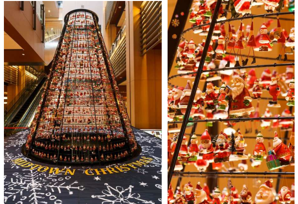
▲小さなサンタが約 1,800 体登場

【期 間】 11 月 15 日(水)～12 月 25 日(月) 【時 間】 11:00～24:00(ガレリア開館時間) 【場 所】 ガレリア1F ツリーシャワー