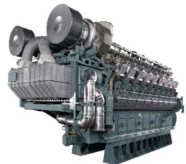
イメージ図