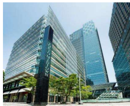
東京ミッドタウン外観

「東京ミッドタウン」は、かつて防衛庁があった土地にホテル（ザ・リッツ・カールトン東京）、文化施設（サントリー美術館、21_21 DESIGN SIGHT など）、商業店舗、オフィス、住宅、医療施設、緑地などが集約された大規模複合都市です。三井不動産グループは、時を経るごとに味わいを増し、魅力を増していく「経年優化」を街づくりの思想に掲げています。安心・安全の観点でも時代に合わせたアップデートを行い、「東京ミッドタウン」が年数を経るごとに魅力が増し、訪れる皆さまやテナント各社にとって「行きたくなる街」であり続けることを目指します。