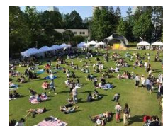
【FOOD & MUSIC】

ハワイを代表するミュージシャンによるライブパフォーマンスやフラパフォーマンス、最高峰のハワイミュージックの祭典「ナ・ホク・ハノハノ・アワード」のオープニングイベントなど最高峰のハワイエンタテインメントが集結。