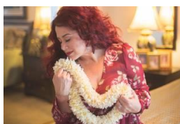
【MUSIC & HULA】