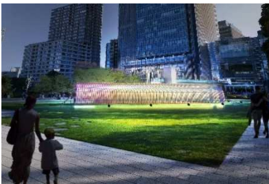
“やさい”に注目したインスタレーション 「デジベジ -Digital Vegetables- by PARTY」