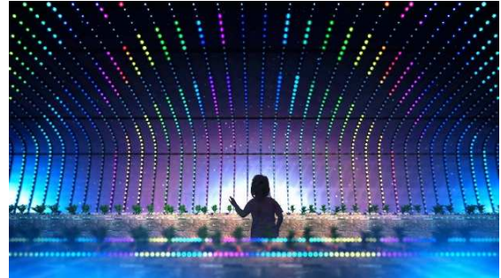
▲夜はライトアップがされ幻想的な空間になります