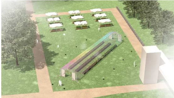
▲都会のまん中に巨大なビニールハウスが出現します

今年のデザインタッチのテーマ「ふれる」をインタラクティブに体験できるインスタレーションです。わたしたちが日々ふれている“やさい”に着目。芝生に設置された奥行き 30m、幅 6m の巨大なビニールハウスの中に植えられた野菜に触れると、野菜の花、種、葉の色が映像と音になって空間に広がります。普段なにげなく接している“やさい”がデジタル技術により新たな体験としてデザインされます。