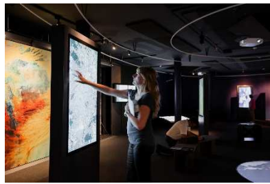
「未来の学校 powered by アルスエレクトロニカ」