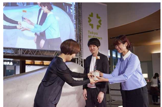
▲昨年の授賞式の様子