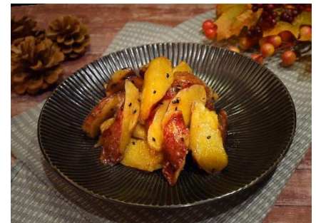
▲秋のサラダバーイメージ

ブロンコビリーのサラダバーには、生野菜のサラダ以外にも、お子様が大好きな「コーン」「ポテトサラダ」や「ツナマヨのパスタサラダ」、季節限定で秋のサラダバーメニューには、「大学いも」や「マスカットゼリー」もご用意しております。季節限定のサラダバーは、日本野菜ソムリエ