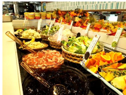
▲サラダバーイメージ