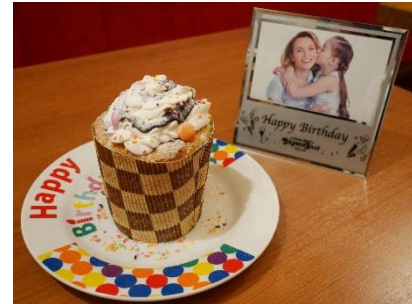
▲ケーキ&フォトフレームイメージ

さらに、お誕生月にはスタッフみなでお祝いをいたします。バースデーソングに合わせて、歌とバースデーケーキのプレゼントや、記念撮影した写真をその場でオリジナルフォトフレームに入れて、お渡しさせていただいております。毎年このサービスをご利用いただき、記念写真を見比べることで、“お子様の成長を楽しめる”とのお声もいただき、ブロンコビリーで人気のサービスです。