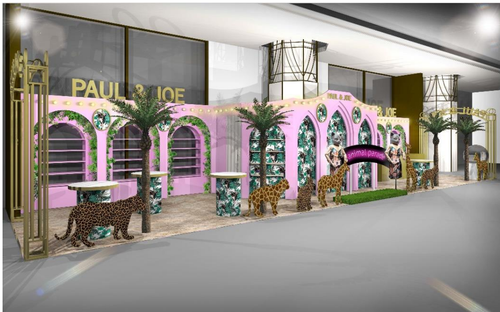
【ポップアップストア『PAUL & JOE ANIMAL PARADE』イメージ】

■ PAUL & JOE 『ANIMAL PARADE』 : http://www.paul-joe-beaute.com/jp/event/parade2018