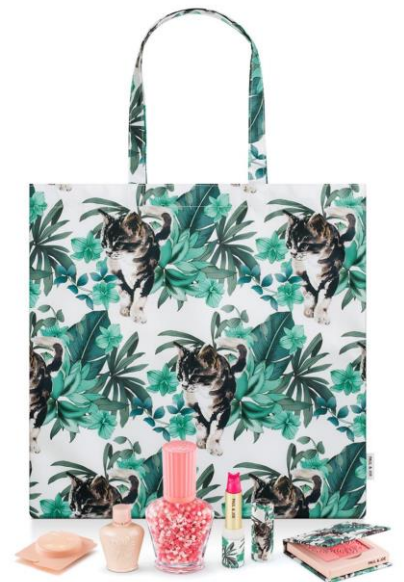
【オンライン限定セット】