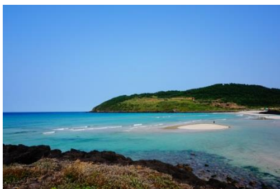
【チェジュ イメージ図】

- 長く続いたアジア近隣都市人気から一転、オーストラリアやヨーロッパの旅行地もネクストブレイクの傾向！ -