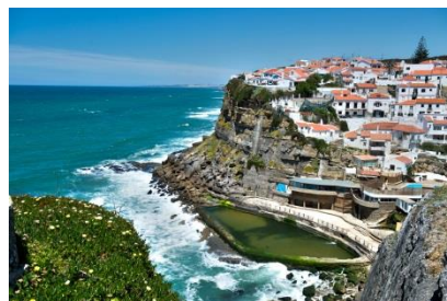
【リスボン イメージ図】

2018年9月27日 - 世界を牽引する旅行検索エンジンである KAYAK ( https://www.kayak.co.jp/ ) は APAC の KAYAK サイト利用者を対象に調査し、検索数トップ 30 の人気旅行先を除いて、検索率が上昇し、今後更なる検索が見込まれる旅行先を“今訪れるべき”ネクストブレイク旅行先ランキングトップ 10 として発表いたしました。本調査により、日本の KAYAK サイト利用者に前年比検索上昇率 300%以上の圧倒的な伸び率で検索されているネクストブレイク旅行先は韓国・チェジュであることが判明いたしました。また、近隣のアジアの都市への旅行熱から一転、オーストラリアから 3 都市がランクインしたほか、ヨーロッパやアメリカをはじめ中長距離の都市への注目がうかがえる結果となりました。