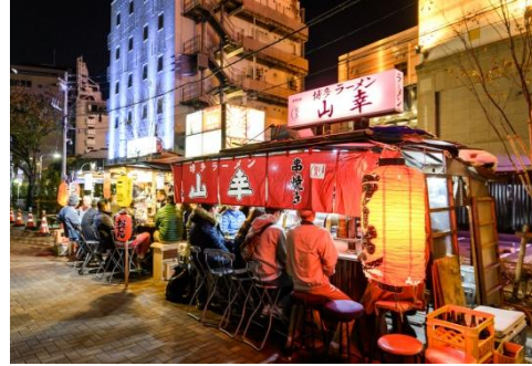
福岡・天神の屋台街

2017年12月20日 - 世界を牽引する旅行検索エンジンである KAYAK (カヤック) は、アジア太平洋地域 (以下、APAC 地域) の訪日旅行者が、2017年に KAYAK.co.jp 上で検索した日本の都市に関するデータを発表いたしました。