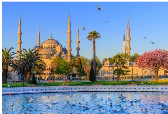
【トルコ・イスタンブール】

－ 梅雨から脱出！節約率 1 位のイスタンブールは昨夏の平均旅費と比べ 50%近く節約が可能－