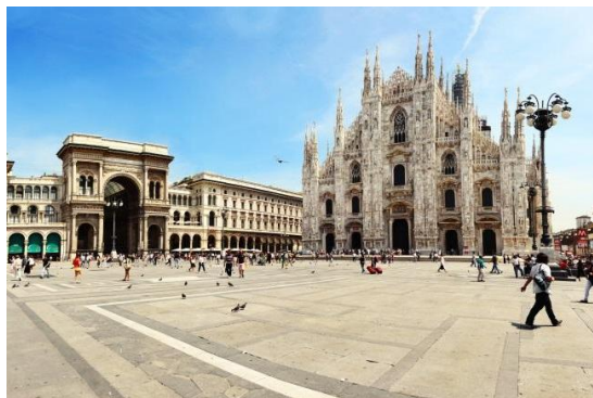
【イタリア・ミラノ】

2018年5月22日 - 世界を牽引する旅行検索エンジンである KAYAK (カヤック) は KAYAK.co.jp ( https://www.kayak.co.jp/ ) を利用する旅行者を対象に調査し、この夏注目の「お財布に優しいヨーロッパの旅行先ランキング」を発表しました。本調査により、憂鬱になりがちな梅雨シーズンを含め、この夏お得に旅が出来るヨーロッパ都市と昨夏の平均旅費からの節約率が明らかとなりました。