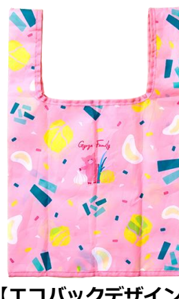
【エコバックデザイン】