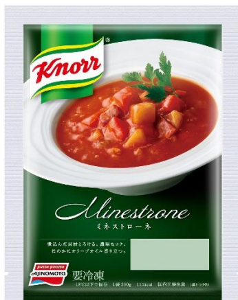
「クノール®」ミネストローネ (新製品/地域限定品)

北海道産野菜をたっぷり使用し、それぞれの野菜の味や風味、彩りを活かした、贅沢な味わいを楽しめる冷凍スープです。「クノール®」ミネストローネは、キャベツ、じゃがいも、にんじんなど、北海道産野菜をたっぷり使用した香り豊かで濃厚な味わいで、オリーブオイルの華やかな香りを立たせ、お店で食べるようなスープの味に仕上げました。「クノール®」クラムチャウダーは、皮つきのじゃがいも、にんじん、乳、帆立貝柱など、北海道産の素材をたっぷり使用した、帆立のうま味と乳の濃厚なコクが溶け込んだクラムチャウダーです。