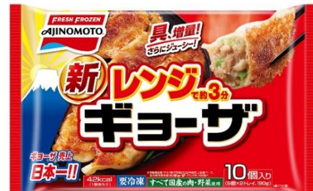
「レンジでギョーザ」 (リニューアル品)