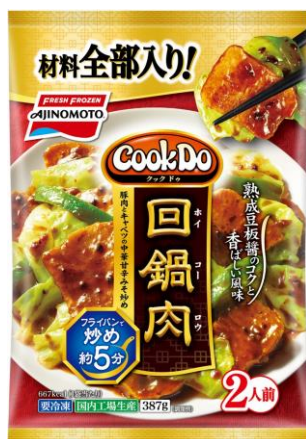
「Cook Do®」回鍋肉 (新製品/地域限定品)

シェフの作り方にない、「Cook Do®」回鍋肉のキャベツは素揚げを行い、「Cook Do®」青椒肉絲の豚肉やピーマンは細切りにするなど、丁寧な下ごしらえから味つけまでこだわっています。ご家庭ではフライパンで炒めるひと手間だけで、手作り料理を楽しみながら簡単においしい中華のメインおかずを作ることができます。