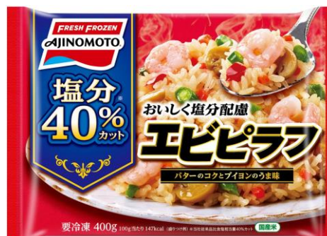
「おいしく塩分配慮エビピラフ」 (新製品)