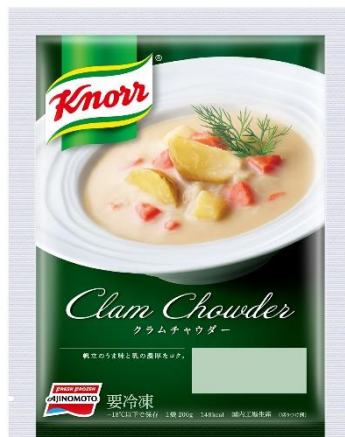
「クノール®」クラムチャウダー (新製品/地域限定品)