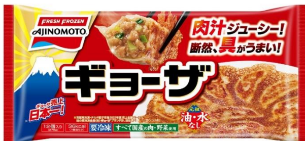
「ギョーザ」 (リニューアル品)

また、電子レンジで約3分調理するだけで、香ばしい焼き目がついた餃子が味わえる「レンジでギョーザ」は、香味野菜の風味やジューシーさ、食べ応えをより感じられるように、中具がさらにおいしくなり、具の量も1個当たり2g増量しました。