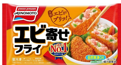
「エビ寄せフライ」 (リニューアル品)

お弁当に入れるおかずとして便利な「エビ寄せフライ」と「えびとひじきのふんわり揚げ」は、おいしさそのままに、それぞれ従来品と比較し塩分に配慮した製品設計にリニューアルします。“毎日食べるものだからこそ、健康に配慮でき、手軽に調理できるものを使って欲しい”という想いから、今回のリニューアルにいたしました。