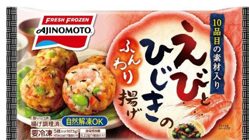
「えびとひじきのふんわり揚げ」 (リニューアル品)