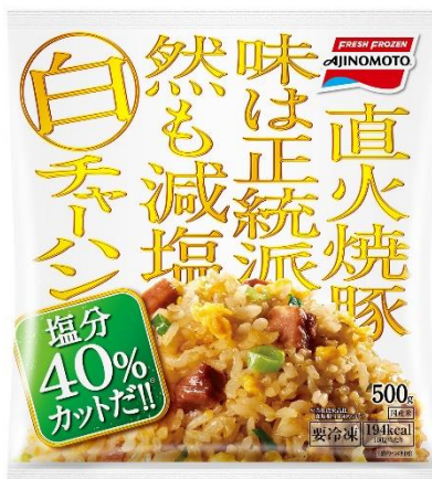
「白チャーハン」 (新製品)