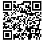
キャンペーンサイト QR コード