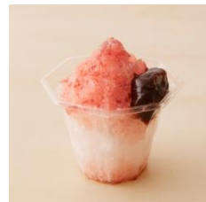
TORAYA CAFÉ・AN STAND 館鼻則孝リ・シンク展限定かき氷