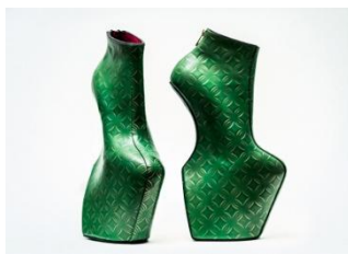
ヒールレスシューズ、2017 © NORITAKA TATEHANA, 2017