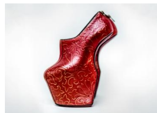
ヒールレスシューズ、2014 © NORITAKA TATEHANA, 2017