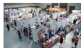
ビジネス・サミット2018 展示会場