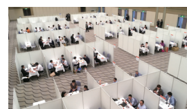
ビジネス・サミット2018 個別商談会場