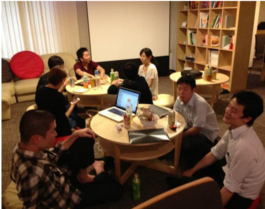
英語でプレゼン&ディスカッション