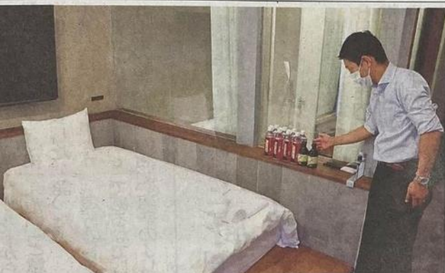
プランで使用される客室。酵素ドリンクや ミネラル水が用意される（長岡京市天神1 丁目・ディスカバー京都長岡京）

公園は、天王山の登山口前 に位置する。復元瓦を施し たあずまやを設置した広場 から、階段を伝って遺構群 のある低地に続く。排水溝跡 を色づけして園路にしたほ