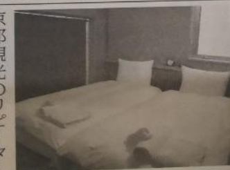
「コンクリート打ちっぱなし」の居 室も特徴の一つ

利用料金は大型の居室 が1万8000円で、小 型の居室が1万円ほど。 京都観光のリピーター で、文化や伝統に関心 の高い知識層の外国人を主 なターゲットとしている。 京都市内の宿泊施設 では供給過剰による価格 競争が起きているが、体 験型で施設の差別化を行 うことで、利用者層の競 合も防いでいく狙いとし