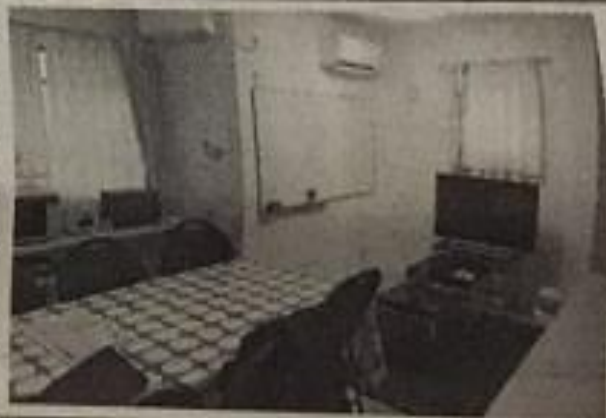
リビングダイニングにはホワイトボードを設置し、コミュニケーションを促進する

日本人のハウスマネージャーが入居し、新たに入居者が入った際には既存入居者との顔合わせ