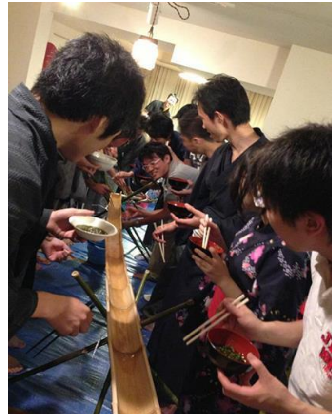
各国の文化をテーマにした 国際交流パーティーを毎月開催