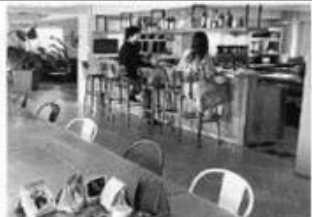
居住者とオフィス利用者の両方が利用できる共用ダイニング (東京・原宿の「ザ・シェア」)