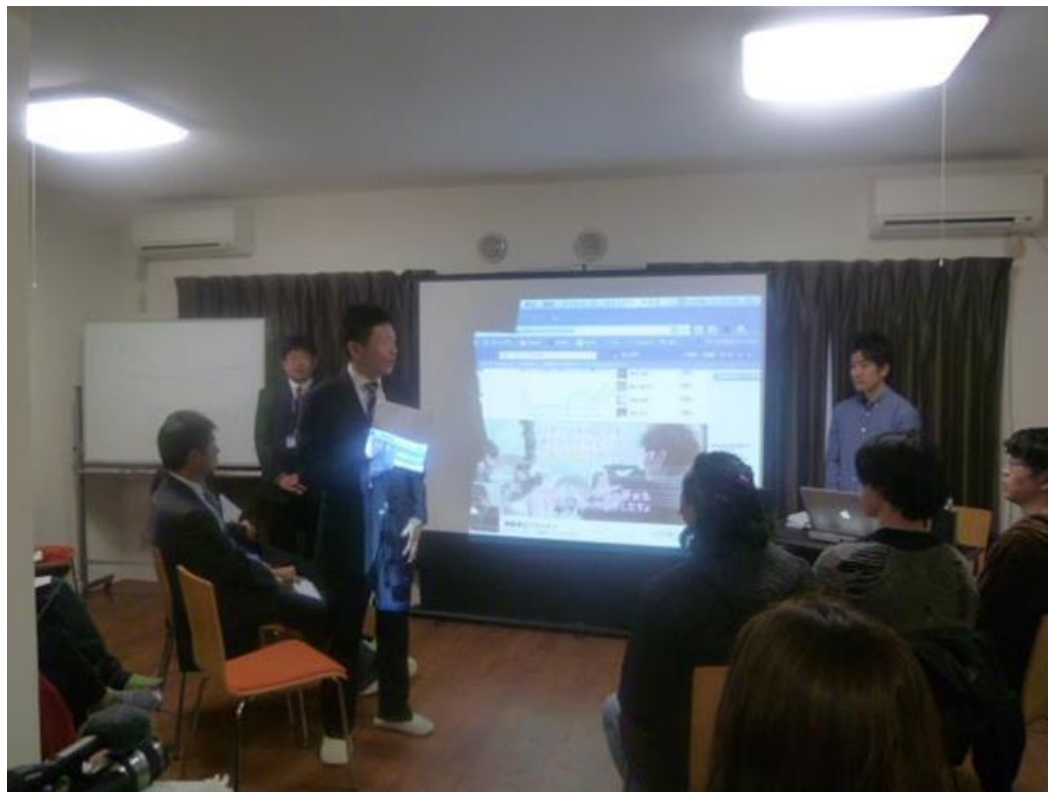
ベテラン経営者を招いてビジネスプランコンテスト

きめ細かいファシリテーションにより入居者の高い満足度を獲得。 一度満室になれば、ロコミで満室続きに。