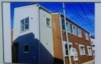
TOKYO SHARE 石神井公園 外観