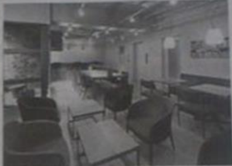
東京・銀座の協働オフィス「リーグ」。 異分野の人と知り合えるのが特徴