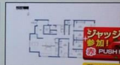
TOKYO SHARE 石神井公園 内部