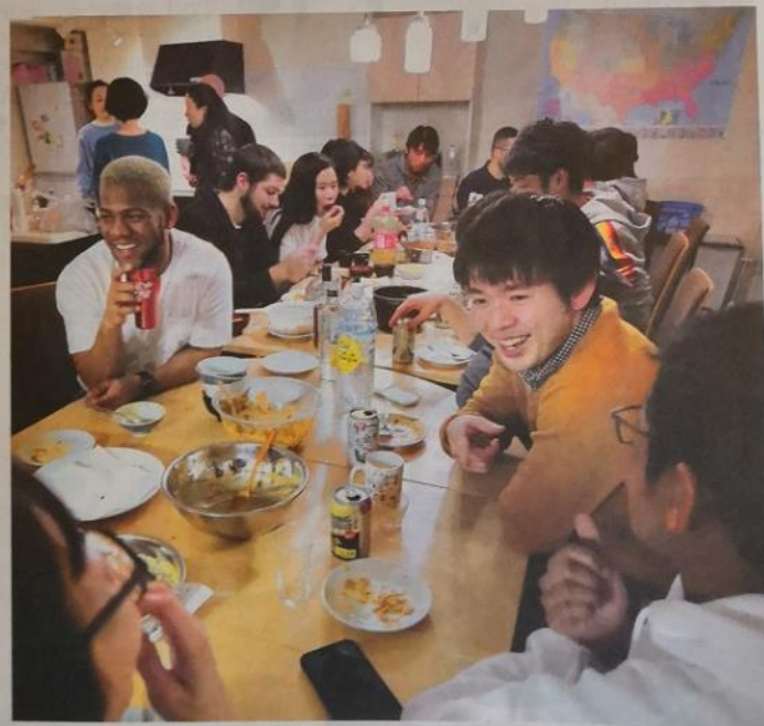
「Let's speak English (英語を話そう)」。シェアハウスの居間では英語での会話がルール。入居者の友人らを招いた「国際交流パーティー」も定期的に開かれ、日本にいなながら留学しているような気分が味わえる(1月26日、東京都大田区の「CROSSWORLD大森」で)