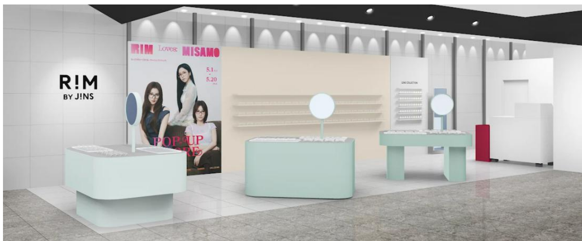
RIM loves MISAMO POP-UP STORE 渋谷スクランブルスクエア店