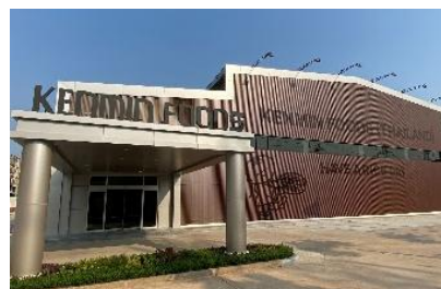
KENMIN FOODS (THAILAND) CO.,LTD.

タイの自社工場では、GMP・HACCPやFSSC22000など国際基準の認証を取得し、日本人スタッフ管理のもと、グローバル品質の管理体制を整えています。