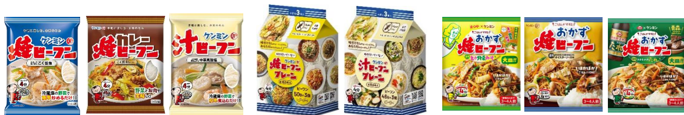
ケンミン 焼ビーフン こく旨塩

野菜を手軽に美味しく食べられる焼ビーフンシリーズは、「フライパンひとつで野菜をもっとおいしく」をコンセプトに定番の鶏だし醤油味他、塩味、カレー味、スープタイプの汁ビーフン、お好みの味付けでアレンジを楽しめるプレーンタイプや、おかずとして食べるおかず焼ビーフンといった様々な商品展開をしています。これからも時代のニーズとともに進化し、お客様の健康と豊かな食生活に貢献する商品作りを続けてまいります。