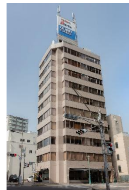
ケンミン食品本社 (神戸)