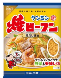
ケンミン焼ビーフン

KSP-POS食品スーパーその他農産カテゴリー 売上No.1 （2024年1月～12月）