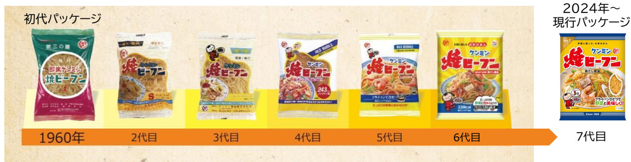
歴代ケンミン焼ビーフンパッケージ