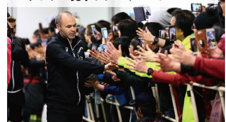
スタジアム見学ツアーイメージ