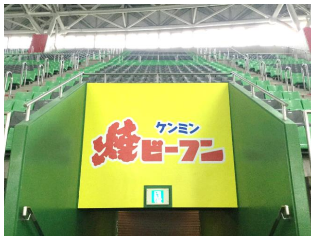
ノエビアスタジアム看板