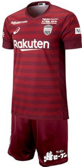
ヴィッセル神戸 2019 レプリカ 1st ユニフォーム