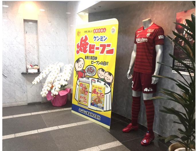
ケンミン食品本社エントランス (神戸市)