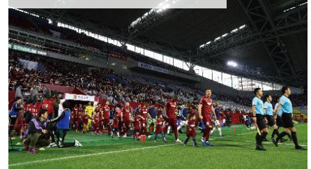
エスコートキッズイメージ