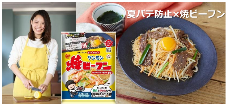
夏バテ防止×焼ビーフン

疲れた時にも食欲をそそるピビンバ風の焼ビーフン。お家で残りがちな焼肉のたれを使って簡単にアレンジ。お子様にも食べやすく、ご飯が進むひと皿。具材は簡単にアレンジでき、買い出しに行く時間がない時にも気軽に楽しみ頂けます。