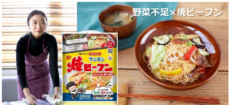
野菜不足×焼ビーフン

大き目にカットした野菜の香ばしさと食感が楽しめる焼ビーフン。フライパンひとつで作れるので、後片付けも簡単。おうちにある野菜が、手軽に夕食の一品になるレシピです。