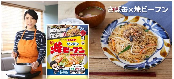
さば缶×焼ビーフン

macaroni で人気のさば缶を使ったお手軽焼ビーフン。材料と一緒に電子レンジで加熱するだけなので、忙しい平日の夕食にピッタリな簡単ビーフンレシピです。