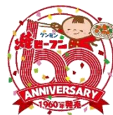
ケンミン焼ビーフンシリーズ売上