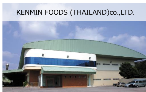
ビーフン製造工場