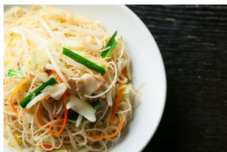
お米 100%ビーフン調理イメージ