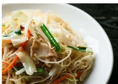
■ □ 福建焼ビーフン □ ■ 400円(税込)