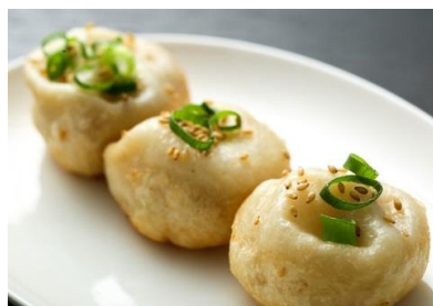
■ □ 焼小籠包(上海生煎饅頭) □ ■ 3個 350円(税込)