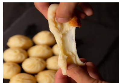
■ □ 起司煎包(チーズチェンパオ) □ ■ 3個 400円(税込)