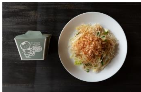
店舗のメニューで限定販売