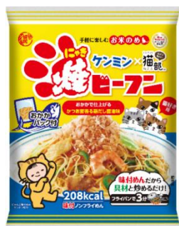
コラボ商品「焼(にゃき)ビーフン」

ケンミン×フェリシモ猫部・猫好き向けコラボ商品「焼(にゃき)ビーフン」が、お店のメニューとして登場します。猫が好きなかつお節がたっぷりトッピングされ、 まるで猫になった気分 で食べられます。(※ご注意)猫が食べるメニューではありません。