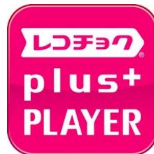
「レコチョク plus+」アプリアイコン

※「着うた®」「着うたフル®」「着うたフルプラス®」は、株式会社ソニー・ミュージックエンタテインメントの登録商標です