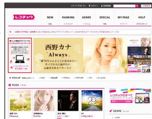
PC TOP ページイメージ画像