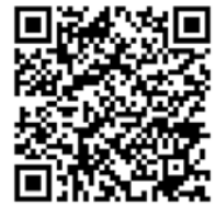
キャンペーンページ QRコード