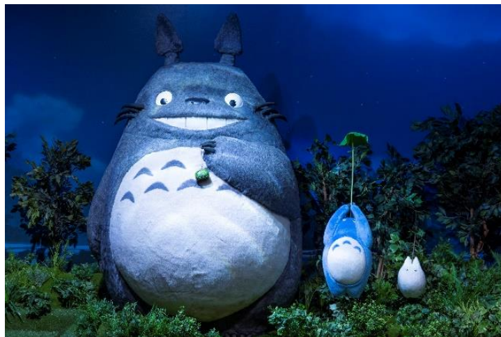
「大・中・小トロフオトスポット」

「大・中・小トロフオトスポット」は、あの名シーンを再現しており、その世界観の中で写真を撮って楽しむことができます。一緒にどんどこ踊りをおどって写真を撮りましょう。