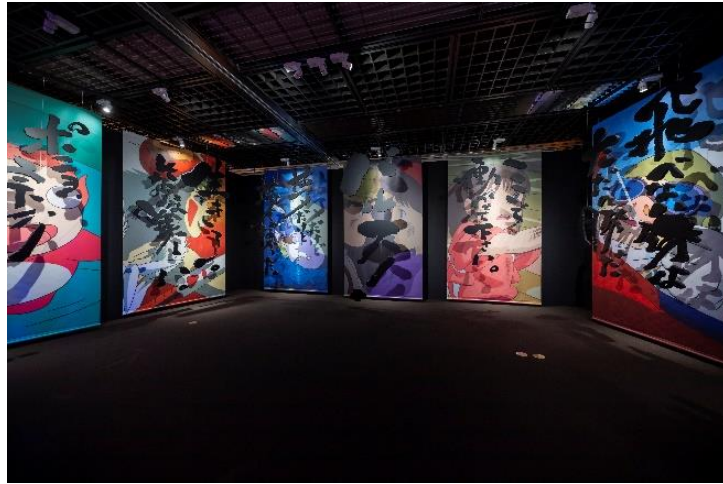
「ジブリ作品名場面と吊り文字」