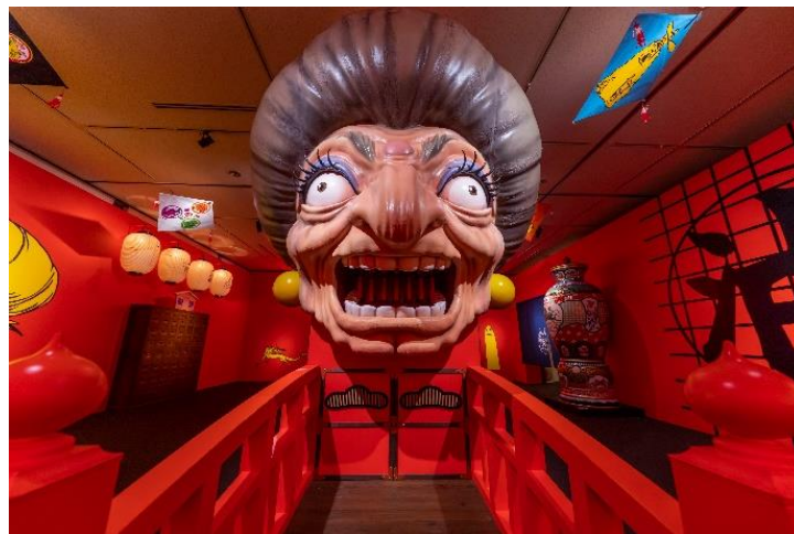
「湯婆婆と銭婆の“恋愛・開運”おみくじ」

高さ3mにも及ぶ湯婆婆と銭婆が圧巻。鈴木プロデューサーの言葉が様々なお悩みにアドバイスしてくれる「おみくじコーナー」は迫力満点です。湯婆婆、銭婆の口に手をいれて番号を引くと、鈴木プロデューサーからの「大事な言葉」が印字されたおみくじがもらえます。