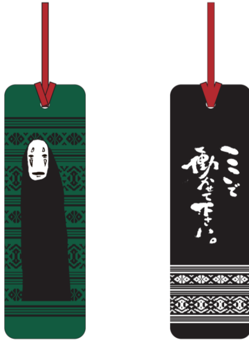
「鈴木敏夫とジブリ展」博多織「栞(しおり)」の2種類セット ※画像は商品イメージです