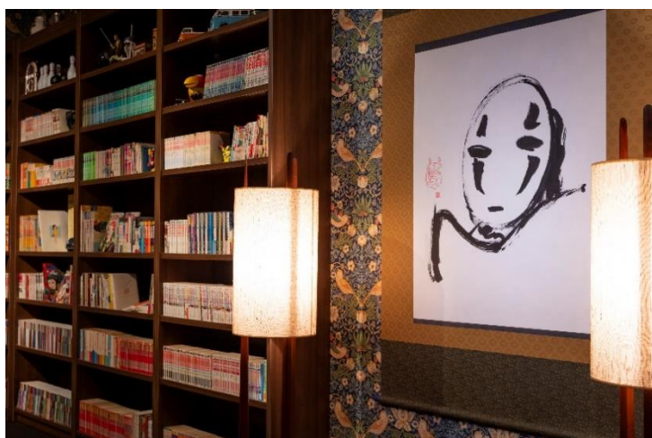
「カオナシ筆画&本棚」